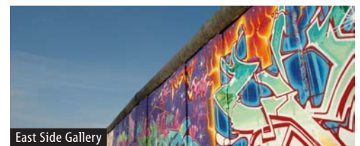
East Side Gallery