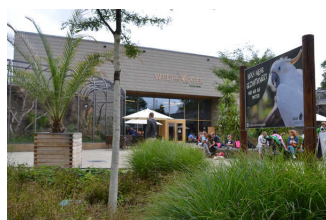
Welt der Vögel