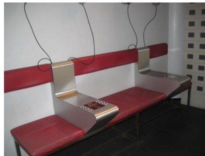
Abb. 9: Ausstellungsbereich