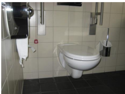
Abb. 11: WC