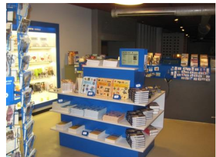
Abb. 13: Museumsshop