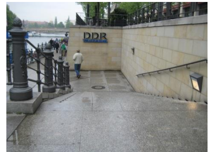
Abb. 4: Treppe zum Haupteingangsbereich