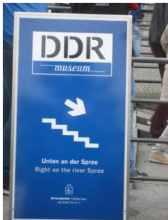
Abb. 2: Aufsteller mit Servicehinweis