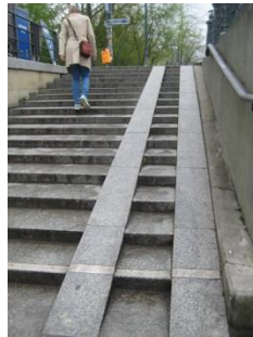
Abb.3: Treppe zum Haupteingangsbereich