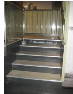
Abb. 7: Treppe zum Ausstellungsbereich ab Kasse