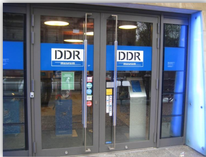
Abbildung 1: Eingangsbereich DDR-Museum