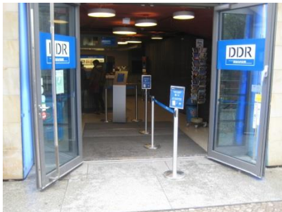
Abb. 5: Eingangsbereich (Haupteingang)