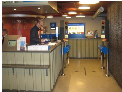
Abb. 6: Museumskasse