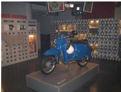
Abb. 8: Ausstellungsbereich