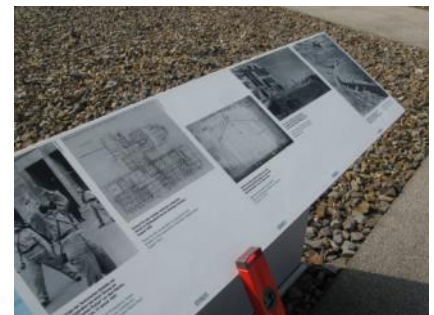
Abb. 37: Infotafeln Außenwege