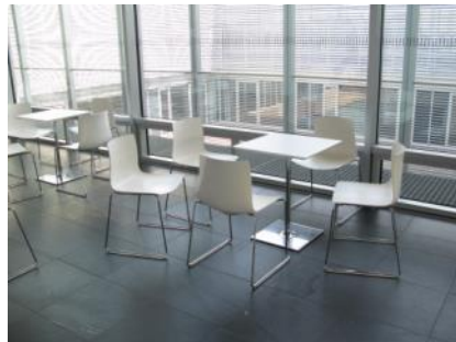
Abb. 11: Cafeteria