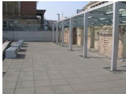
Abb. 27: Ausstellungsgraben