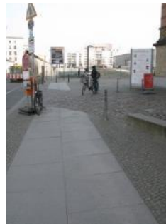
Abb.3: Weg vom Parkplatz zum Eingangsbereich