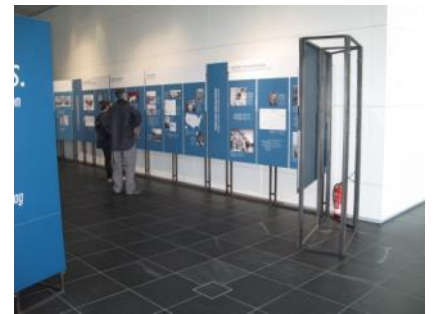
Abb. 9: Ausstellungsbereich