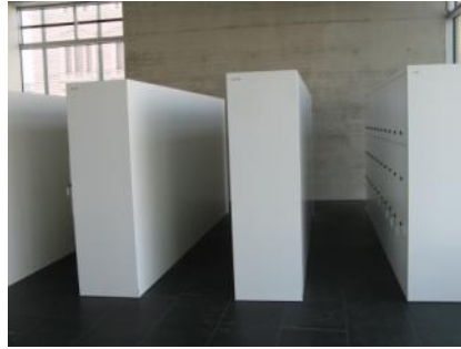
Abb. 12: Schließfächer (Kassenbereich)