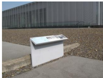
Abb. 36: Infotafeln Außenwege