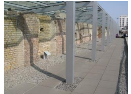
Abb. 28: Ausstellungsgraben