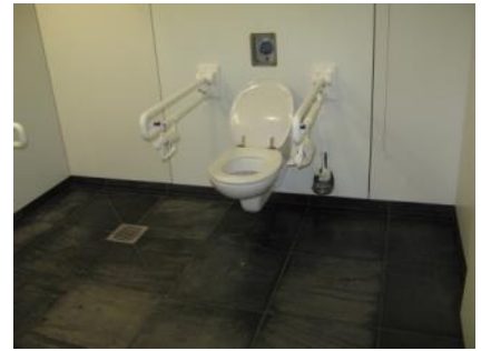
Abb. 22: WC