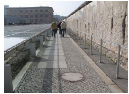
Abb. 34: Außenweg “Berliner Mauer”