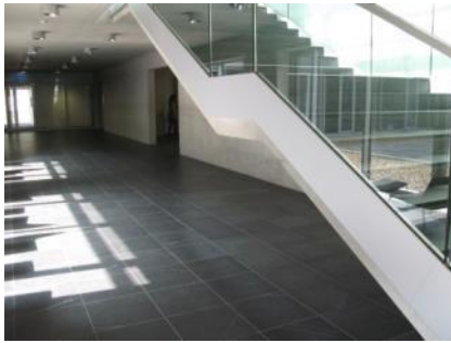
Abb. 20: Treppenhaus