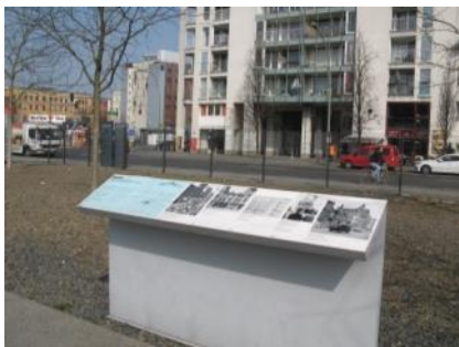
Abb. 35: Infotafeln Außenwege