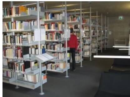
Abb. 143: Bibliothek