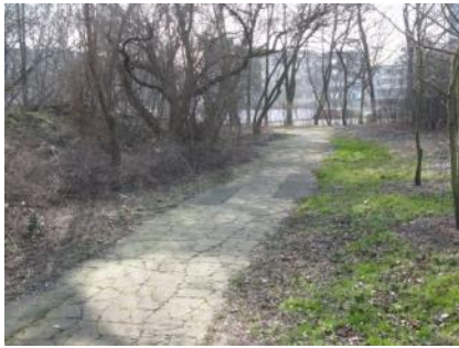
Abb. 32: Außenweg (Abschnitt Autodrom)