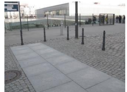
Abb. 4: Eingangsbereich Niederkirchnerstr. (außen)