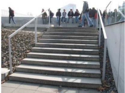
Abb. 26: Treppe zum Ausstellungsgraben