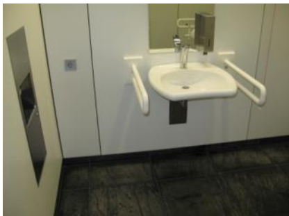
Abb. 133: WC