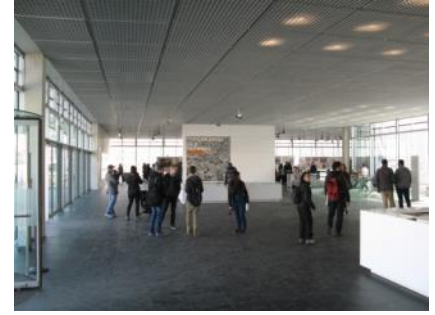
Abb. 6: Ausstellungsbereich