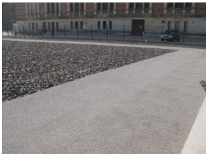
Abb. 29: Rundweg