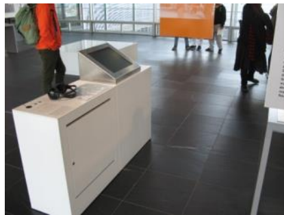
Abb. 8: Ausstellungsbereich