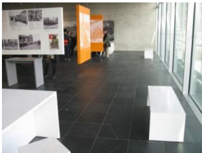
Abb. 7: Ausstellungsbereich