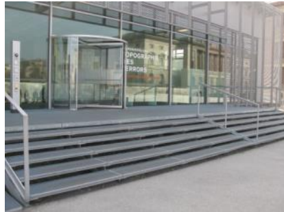
Abb. 6: Treppe (Eingangsbereich)