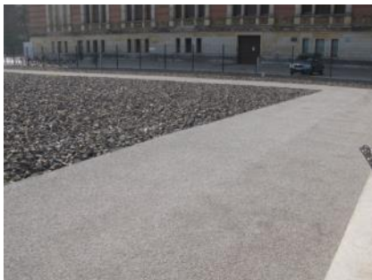
Abb. 27: Rundweg