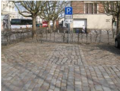
Abb. 2: Parkplatz (Martin-Gropius-Bau)