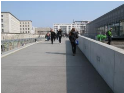
Abb. 5: Außenweg zum Gebäude