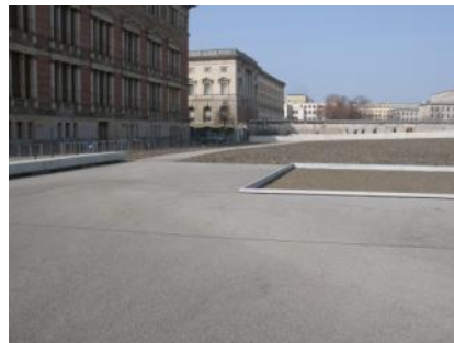
Abb. 28: Rundweg