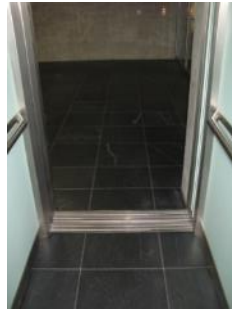
Abb. 19: Aufzug