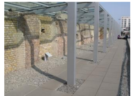
Abb. 26: Ausstellungsgraben