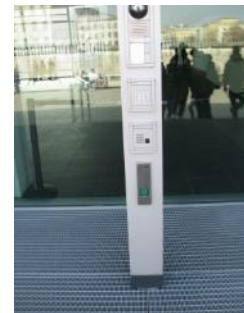
Abb.8: Bedienelemente (Automatiktür)