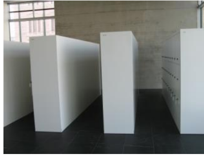
Abb. 10: Schließfächer (Kassenbereich)