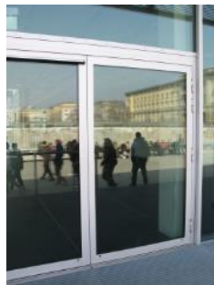
Abb. 7: Eingangstür (Automatiktür)