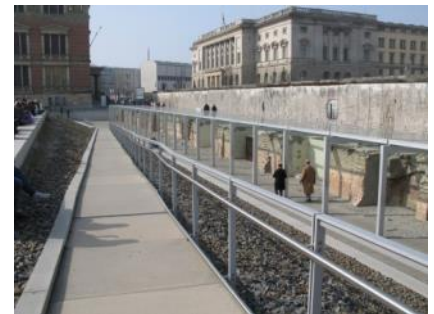
Abb. 23: Rampe zum Ausstellungsgraben