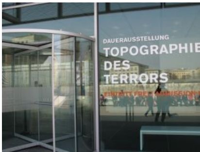
Abb. 6: Eingangstür (Rotationstür)