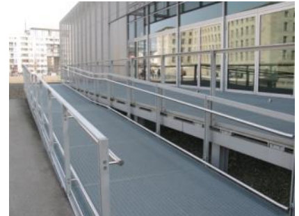
Abb. 7: Rampe (Eingangsbereich)