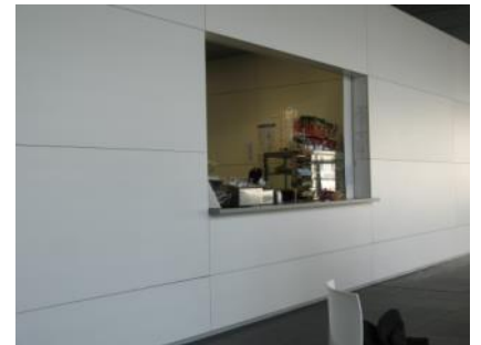
Abb. 17: Cafeteria