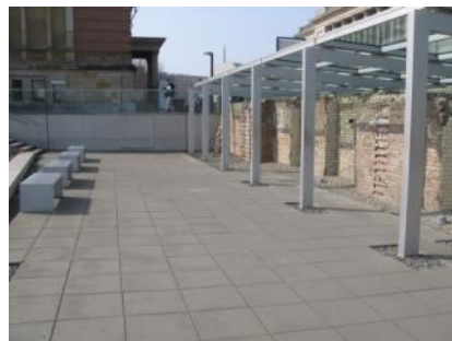
Abb. 25: Ausstellungsgraben