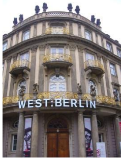
Abb. 2: Eingangsbereich