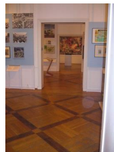
Abb. 16: Ausstellungsräume 1. bis 3. Etage