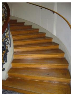
Abb. 11: Treppenhaus