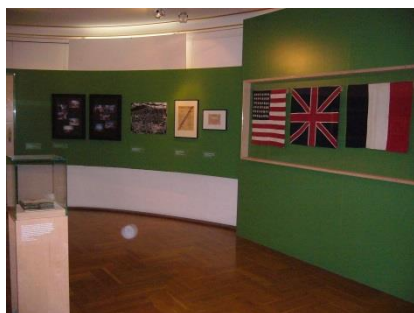
Abb. 17: Ausstellungsräume 1. bis 3. Etage