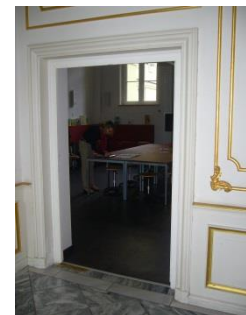
Abb. 7: Tür / Durchgang zum Museumslabor