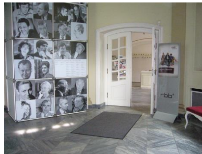
Abb. 3: Vorraum (Eingangsbereich)