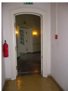
Abb. 14: Gang ab/zum Aufzug