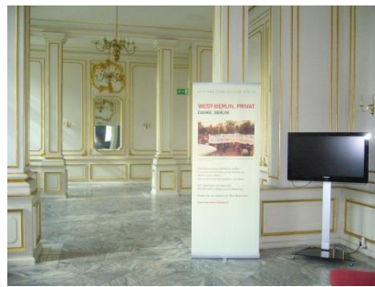
Abb. 6: Ausstellungsräume (EG)