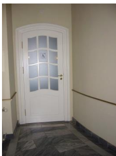
Abb. 18: Tür zum WC