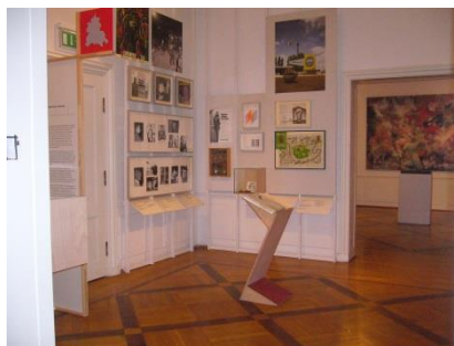
Abb. 15: Ausstellungsräume 1. bis 3. Etage