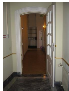
Abb. 13: Gang ab/zum Aufzug