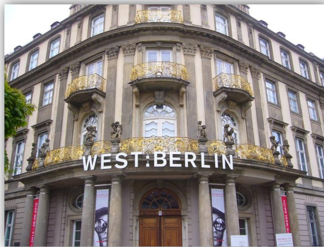
Abbildung 1: Ephraim-Palais