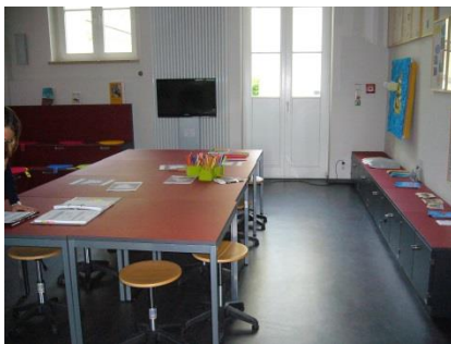
Abb. 8: Museumslabor