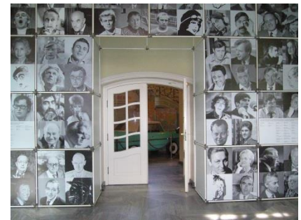
Abb. 4: Vorraum (Eingangsbereich)