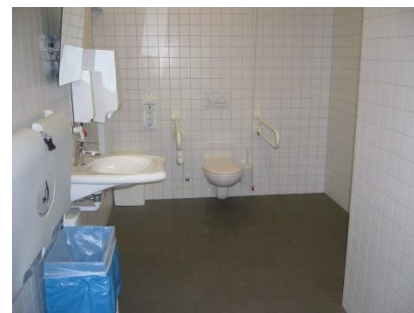
Abb. 19: WC