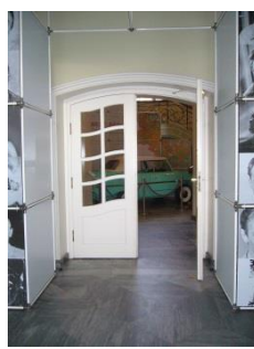
Abb. 9: Tür / Durchgang zu den Ausstellungsbereichen (EG)