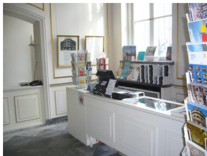
Abb. 5: Kasse