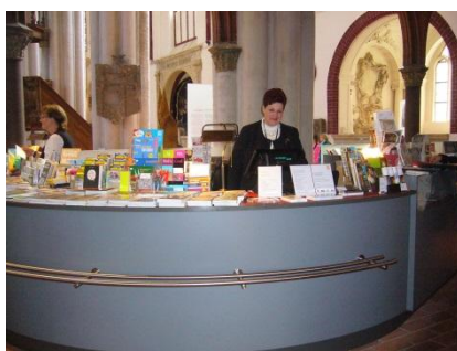
Abb. 6: Kasse / Besucherinformation