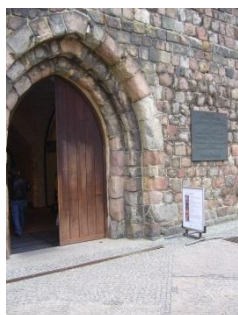
Abb. 3: Eingangsbereich