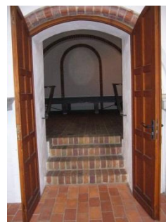
Abb.10: Treppe zur Sakristei