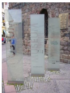
Abb. 2: Aufsteller