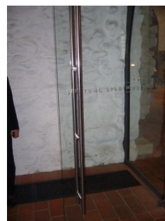
Abb. 4: Windschutztür