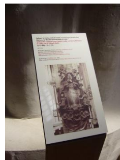
Abb. 13: Beschilderung der Exponate