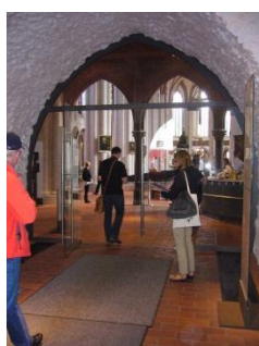
Abb. 5: Gang zur Kasse / Besucherinformation