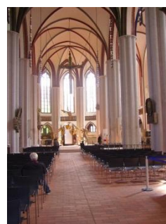
Abb. 7: Hauptschiff der Kirche