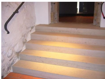
Abb. 12 Treppe zum Münzkabinett