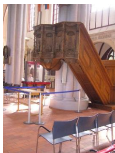
Abb. 8: Kanzel