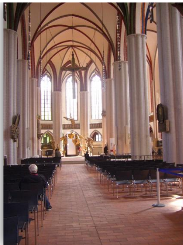
Abbildung 1: Nikolaikirche (Innenansicht)