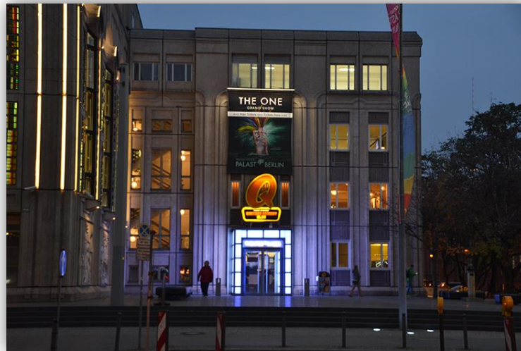
Quatsch Comedy Club