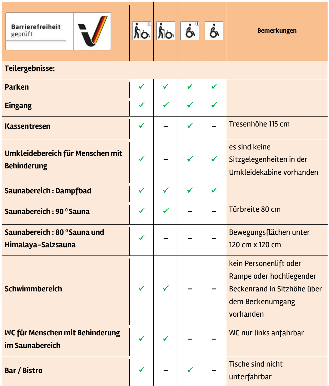
Tabelle 1: Überblick über das Prüfergebnis