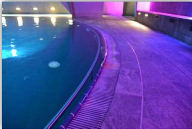
Pool im Liquidrom