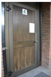
Tür Behinderten- WC