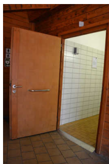
Tür Behinderten- WC