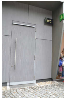
Tür Behinderten- WC