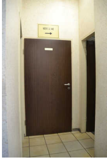
Tür des Behinderten-WC