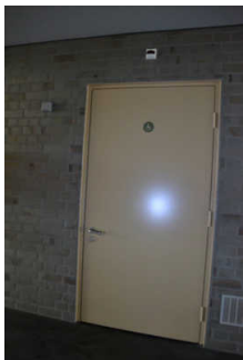
Tür Behinderten- WC (dunkler Flur)