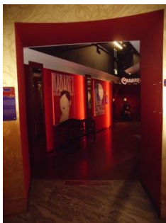
Abb. 5: Ausstellungsbereich