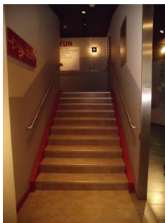
Abb. 8: Treppe vom EG zum OG