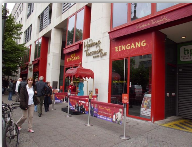
Abbildung 1: Madame Tussauds