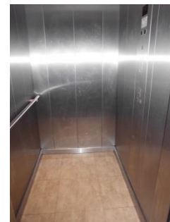
Abb. 7: Aufzug (EG zum OG)