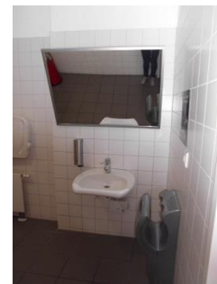
Abb.10: WC für Menschen mit Behinderung