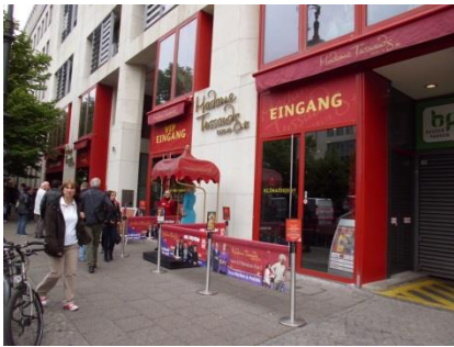
Abb. 2: Ein- und Ausgangsbereich