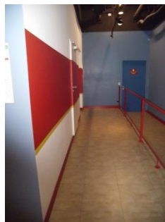
Abb. 6: Rampe zum Aufzug (EG)