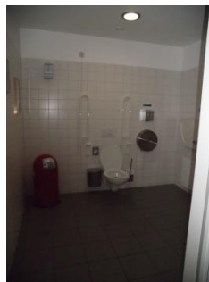
Abb. 9: WC für Menschen mit Behinderung