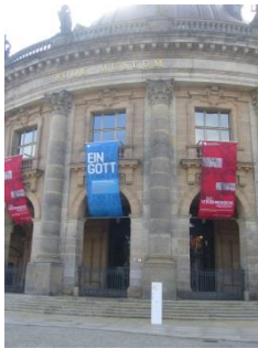
Abb. 2: Außenansicht