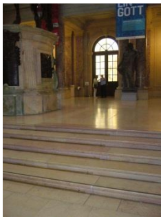
Abb. 8: Große Kuppel