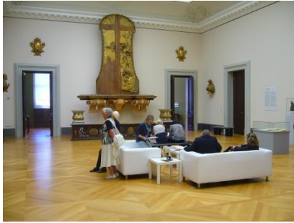
Abb. 14: Ausstellungsräume