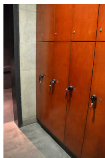
Umkleideraum mit Schließfächern