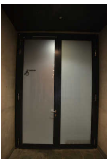
Tür von Flur / Kasse zur Rollstuhl- Umkleide