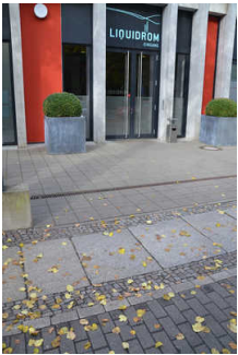
Gehweg vor Eingang