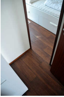
hintere Kabine, sehr enger Durchgang