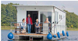
Febomobil 1180