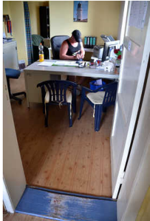
Büro / Rezeption

Anmerkungen für den Gast: Das Büro / Haus muss nicht unbedingt betreten werden. Das Personal kommt ohnehin raus und geht mit den Gästen zum Boot; dort kann auch der "Papierkram" erledigt werden.