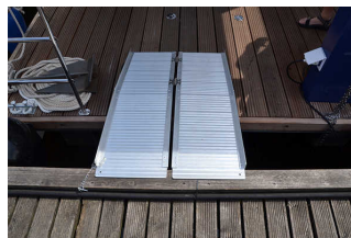
Anlegerampe (hier ungesichert aufgelegt auf Febomobil 990)