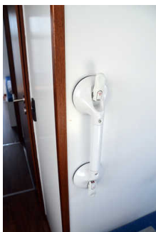
mobiler Vakuum- Haltegriff, auf allen Oberflächen zu befestigen