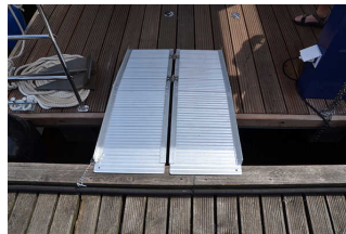
Anlegerampe (hier ungesichert angelegt)