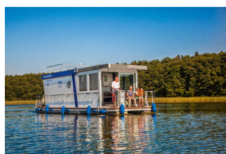
Febomobil 990