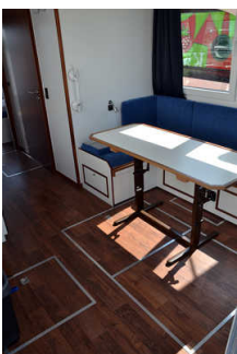
Hauptraum / Schlafräum vorne