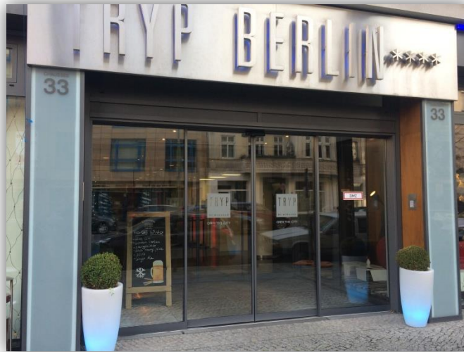
Tryp Hotel Berlin