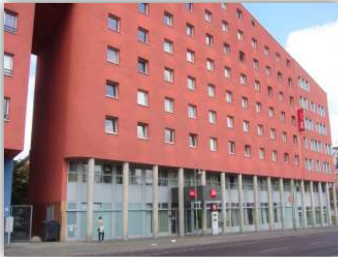
ibis Berlin Ostbahnhof Frontansicht