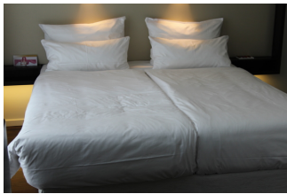
Zimmer 136, 236, 336