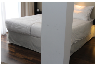
Zimmer 136, 236, 336