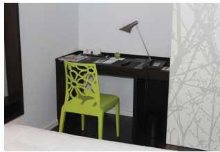
Zimmer 136, 236, 336