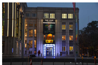
Eingang Quatsch Comedy Club