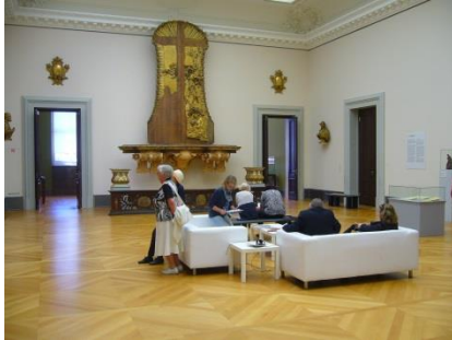
Abb. 14: Ausstellungsräume