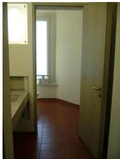
Abb. 20: Öffentliches WC (Ebene 0)