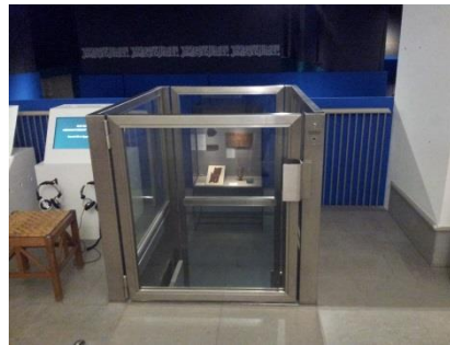
Abb. 18: Hublift Ebene 0 /-1