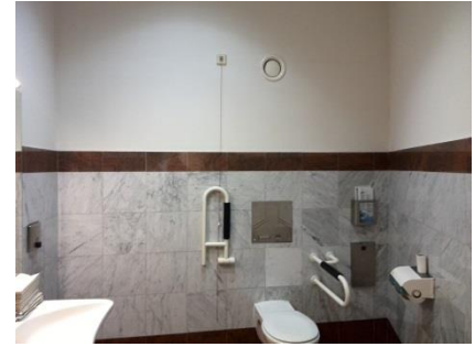
Abb. 25: Öffentliches WC (Ebene 1, Raum 122)