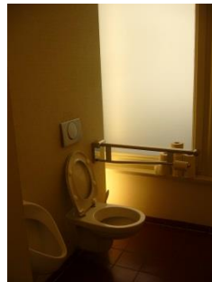
Abb. 21: Öffentliches WC (Ebene 0)