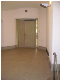
Abb. 17: Aufzug und Flur