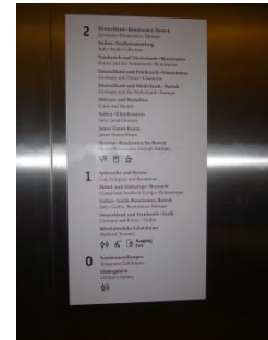
Abb. 28: Besucherlenkung