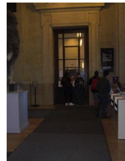
Abb. 7: Foyer (Kasse, Garderobe)