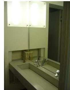
Abb. 22: Öffentliches WC (Ebene 0)