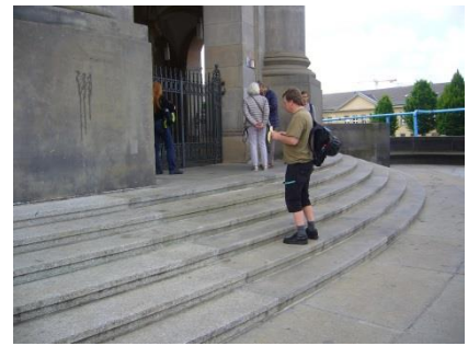
Abb. 4: Eingangsbereich