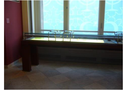
Abb. 16: Exponate / Tische