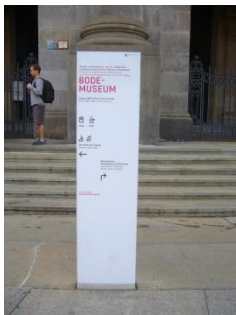
Abb. 5: Informationssäule