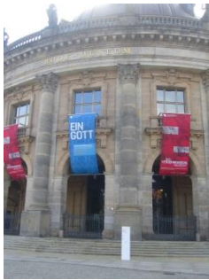
Abb. 2: Außenansicht