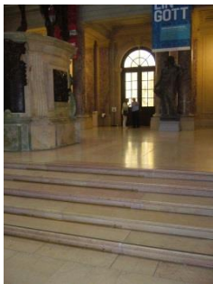
Abb. 8: Große Kuppel