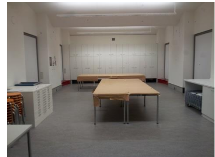
Abb. 19: Werkraum