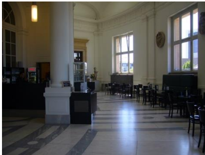
Abb. 26: Museumscafé