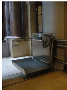
Abb. 9: Treppenplattformlift