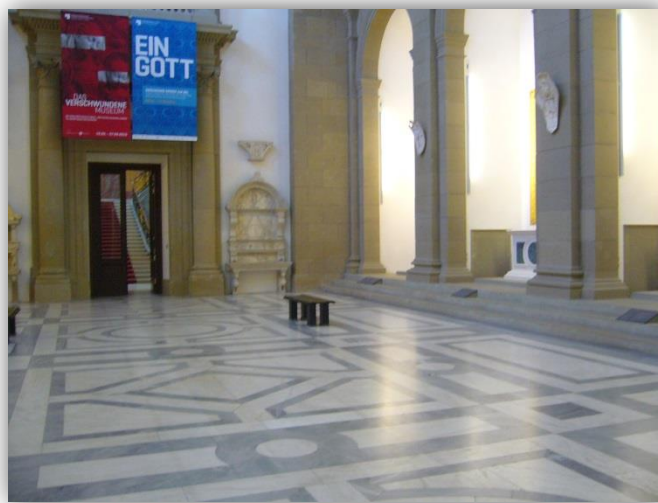
Abbildung 1: Bode-Museum (Innenansicht)