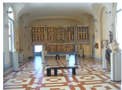
Abb. 13: Ausstellungsräume