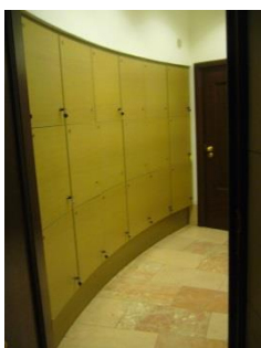
Abb. 11: Schließfächer