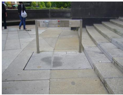
Abb. 3: Treppenhublift