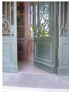
Abb. 6: Eingangstüren