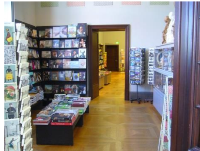
Abb. 27: Museumsshop