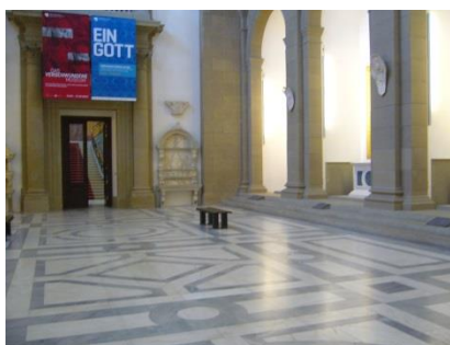
Abb. 12: Ausstellungsräume