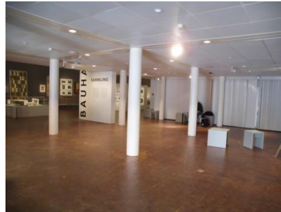
Abb. 6: Foyer (Dauerausstellung)