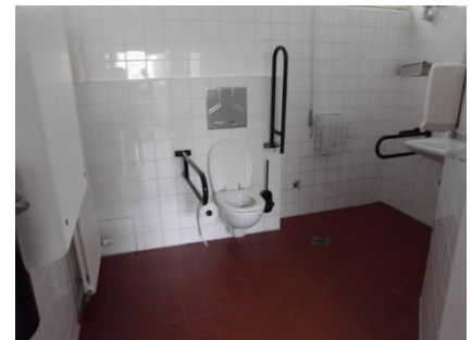
Abb.10: Öffentliches WC