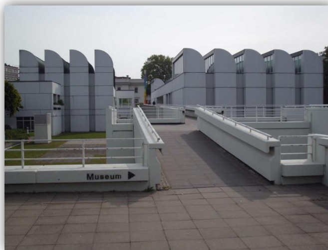
Abbildung 1: Bauhaus-Archiv