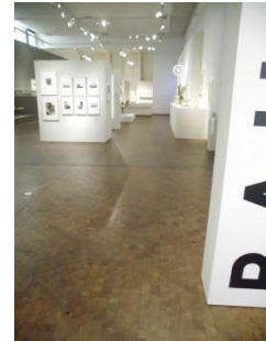
Abb. 7: Dauerausstellung