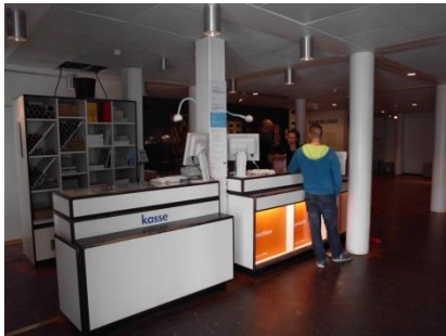
Abb. 5: Kassenbereich (Foyer)