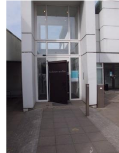
Abb. 4: Eingangsbereich