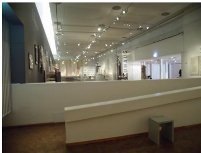
Abb. 8: Rampe im Dauerausstellungsbereich