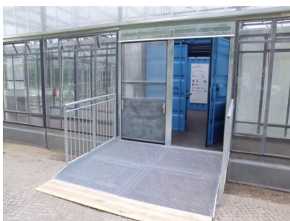
Abb. 15: Ausstellungscontainer