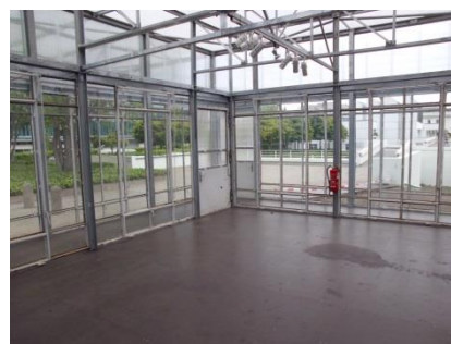
Abb. 16: Ausstellungscontainer