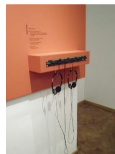
Abb. 22: Audiostation