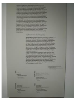
Abb. 20: Texttafel