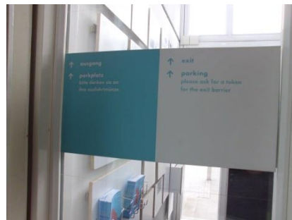
Abb. 19: Leitsystem