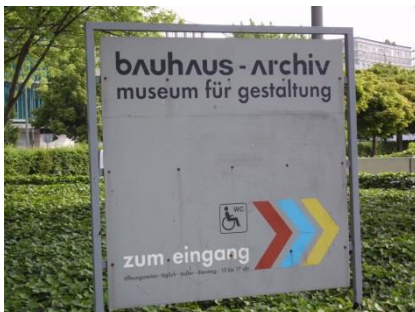
Abb. 18: Leitsystem