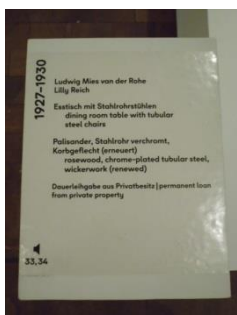
Abb. 21: Texttafel