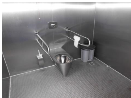
Abb. 17: WC im Ausstellungscontainer