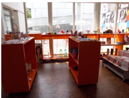
Abb. 12: Museumshop