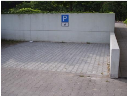
Abb. 2: Parkplatz