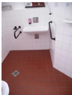
Abb. 11: Öffentliches WC