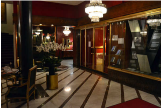
Lobby Hotel Savoy, rechts Tür ins Restaurant