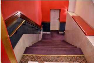
Treppe zu WCs