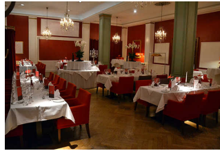
Gastraum Restaurant Weinrot