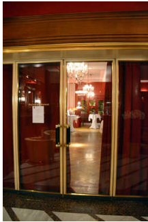
Tür von Lobby ins Restaurant