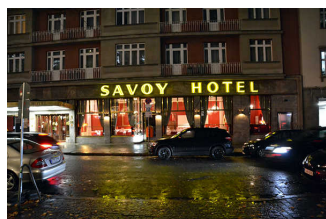
Restaurant Weinrot im Hotel Savoy