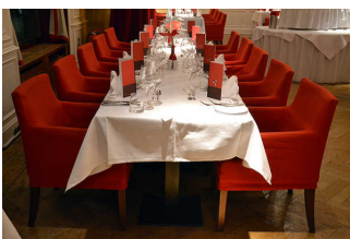
Tisch und Bestuhlung