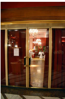
Tür von Lobby ins Restaurant