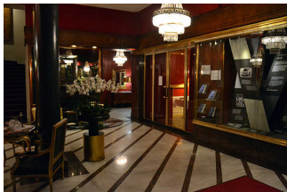
Lobby Hotel Savoy, rechts Tür ins Restaurant