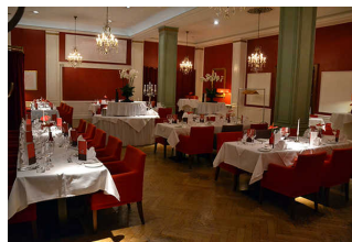
Gastraum Restaurant Weinrot