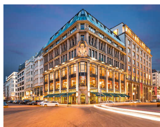
Rausch Schokoladenhaus Berlin