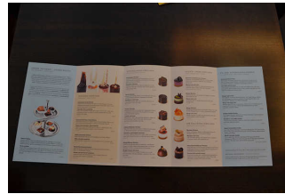
Cafe-Karte (auch online)