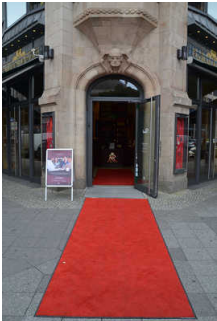
Haupteingang Ecke Gendarmenmarkt