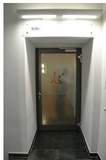
Tür zur Personaltreppe (nur mit Personalbegleitung, Breite 90cm)