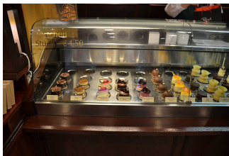
Theke mit Warenangebot

Bewegungsfläche vor der Station/dem Objekt/Exponat - Breite: 150 cm.