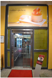
Aufzug, Eingang vom Shop

Breite der Bewegungsfläche vor der Einstieg: 150 cm