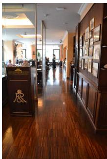
Eingang ins Cafe