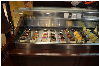
Theke mit Warenangebot