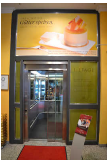
Aufzug, Eingang vom Shop

Die Bedienelemente bzw. die Beschilderung sind weder bildhaft noch (im Falle eines entsprechenden Leitsystems) farblich gekennzeichnet.