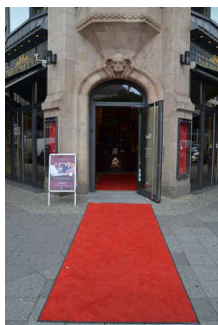
Haupteingang Ecke Gendarmenmarkt

Name und Logo des Betriebes/der Einrichtung sind von außen klar erkennbar.