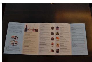
Cafe-Karte (auch online)