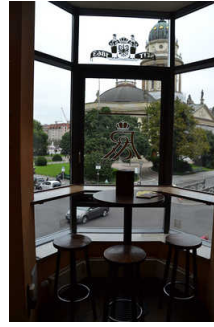
Erker mit Blick zum Gendarmenmarkt