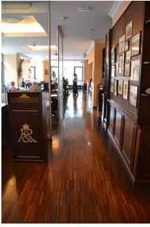
Eingang ins Cafe