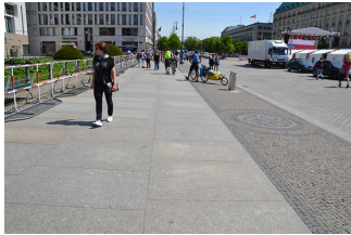
Gehwege am Pariser Platz