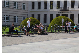
Gehwege am Pariser Platz