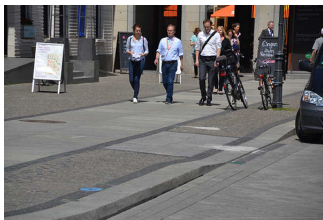
Gehwege am Pariser Platz