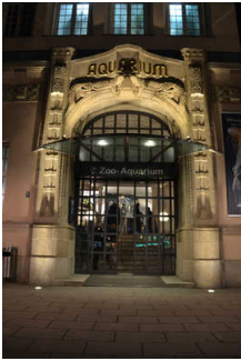
Haupteingang Aquarium Budapester Str.

Anmerkungen für den Gast: Es eine mobile Rampe mit einer Neigung von 10% auf 1 m zu passieren