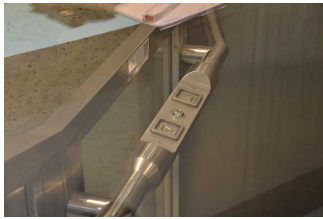
Hublift am Eingang