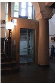
Aufzug im Aquarium