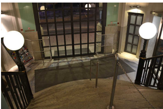
Eingang mit Garderobe (unten)