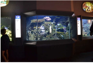
Aquarien mit Infotafeln