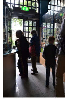
Verengter Eingangsbereich innen