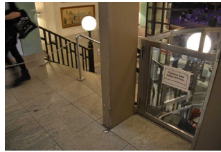
Hublift am Eingang