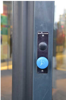
Schalter zum Verlangsamen der Tüрдrehung