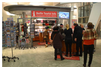
Berlin Tourist Info im Park Inn