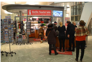
Tresen BTI (Concierge-Theke Park Inn)

Der Schalter/Tresen/die Kasse ist hell ausgeleuchtet.