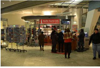
Ovaler Shop im Hintergrund