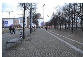
Hauptwege im Lustgarten