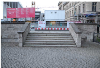
Treppen zur Bodestr.