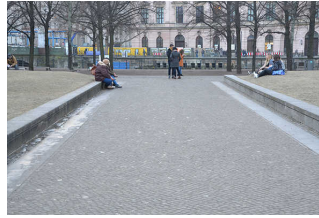
Hauptwege im Lustgarten