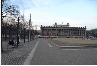
Hauptwege im Lustgarten