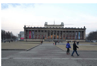
Hauptwege im Lustgarten