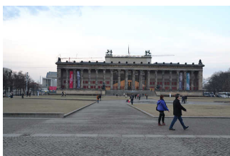
Hauptwege im Lustgarten