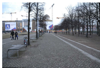
Hauptwege im Lustgarten