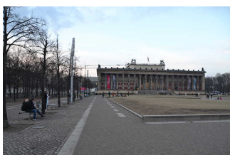
Hauptwege im Lustgarten