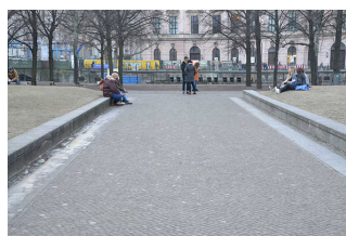
Hauptwege im Lustgarten