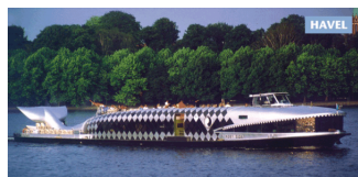
FMS Moby Dick