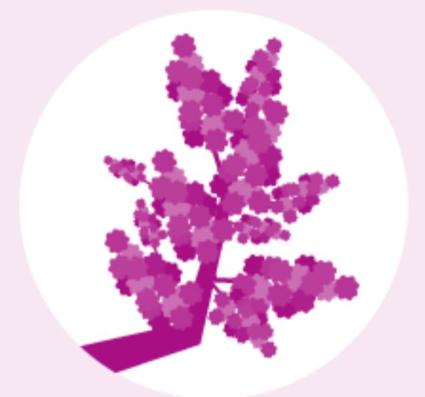
Flieder April bis Juni