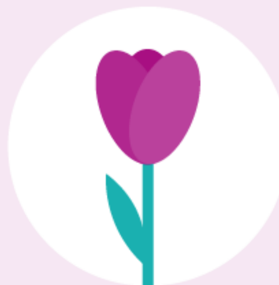
Tulpe April bis Mai