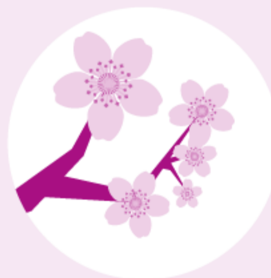
Kirsche März bis Mai