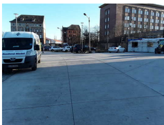
Weg außen (Hafen)