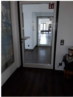
Tür zum WC- Bereich

Die Tür ist keine Karussell- oder Rotationstür.