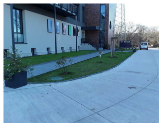
Weg außen (Hafen)