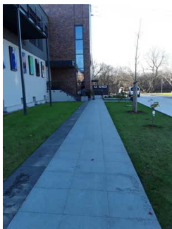
Weg außen (Hafen)