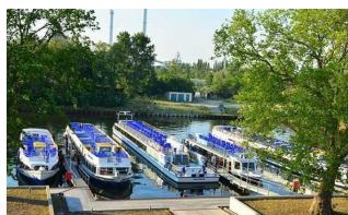
Hafen Rummelsburg