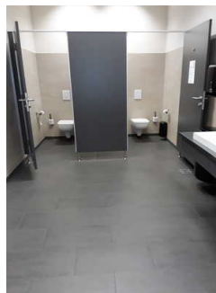
Öffentliches WC im Büro-/ Verwaltungsgebäude