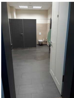
Öffentliches WC im Büro-/ Verwaltungsgebäude