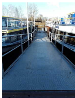
Anleger Hafen Rummelsburg