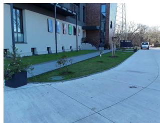
Weg außen (Hafen)