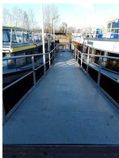
Anleger Hafen Rummelsburg