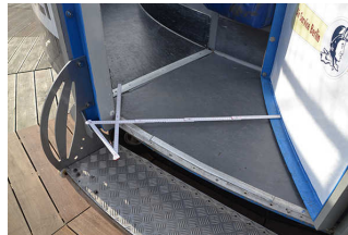
Durchgangsbreite 70 cm

Die Plattform ist über 2 Stufen oder eine Anlegerampe zugänglich. Die Eingangstüren werden durch Personal bedient und können maximal 45° geöffnet werden, wodurch sich eine Durchgangsbreite von 70 cm ergibt. Die kranzförmige Plattform ist umlaufend 85 cm breit und hat ca. 12m Außendurchmesser.