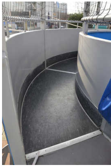
Kreisplattform für Passagiere