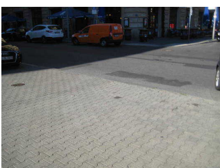
Zuwegung Jägerstraße/ Charlottenstr. bzw. Jägerstraße/ Markgrafenstr.