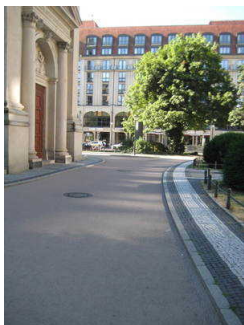
Gendarmenmarkt: asphaltierter Weg im Bereich Deutscher Dom