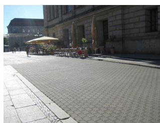
Zuwegung Jägerstraße/ Charlottenstr. bzw. Jägerstraße/ Markgrafenstr.