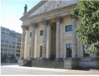
Gedarmenmarkt: Pflaster (u.a. Bereich Deutscher Dom)