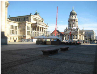
Gedarmenmarkt: Pflaster (u.a. im Bereich Konzerthaus Berlin)