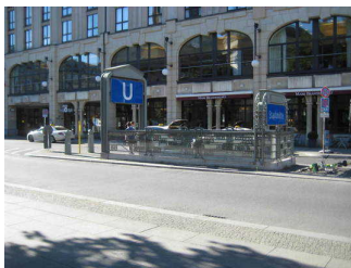
Weg zwischen U-Bahnhof Stadtmitte und Gedarmenmarkt