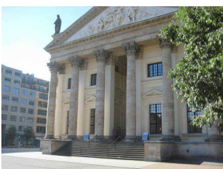
Gedarmenmarkt: Pflaster (u.a. Bereich Deutscher Dom)