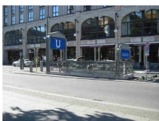
Weg zwischen U-Bahnhof Stadtmitte und Gedarmenmarkt