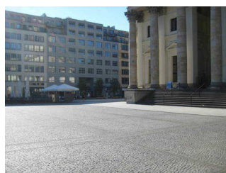
Gedarmenmarkt: Pflaster (u.a. Bereich Deutscher Dom)