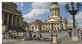
Gedarmenmarkt; Französischer Dom am Gendarmenmarkt