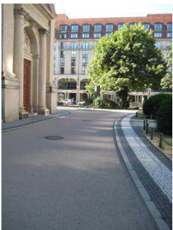
Gendarmenmarkt: asphaltierter Weg im Bereich Deutscher Dom