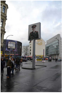
Verkehrsinsel mit Leuchtkasten- Installation