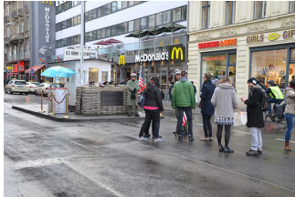
Straßenfläche mittig vor der Baracke