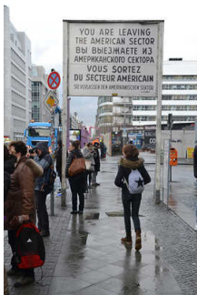
Gehweg mit Schild Sektorengrenze