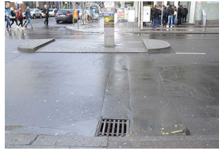
Querungsstelle mit Verkehrsinsel, rechts Zugang zur Fläche vor der Baracke