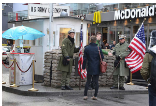
Kontrollbaracke des Checkpoint Charlie