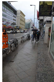
Gehweg Friedrichstr. (östliche Seite)