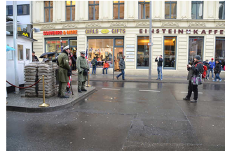
Straßenfläche mittig vor der Baracke