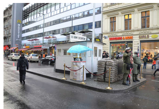
Kontrollbaracke des Checkpoint Charlie

Anmerkungen für den Gast: Der Checkpoint Charlie besteht heute nur noch aus einem Nachbau der ersten amerikanischen Kontrollbaracke mit einem Schild "Checkpoint Charlie" auf dem Dach. Die Baracke befindet sich auf einer Verkehrsinsel mittig in der Friedrichstraße. Zum ursprünglichen Checkpoint zählen auch die anliegenden Fahrbahn- und Gehwegflächen, auf denen noch heute das berühmte Schild "You are leaving the American Sector" sowie eine Leuchtkasten-Installation stehen, die zwei Soldaten zeigt, die ins "Hoheitsgebiet" des jeweils anderen blicken. Angrenzend, aber nicht zum Checkpoint gehörend, liegen das "Haus am Checkpoint Charlie" sowie verschiedene Ausstellungsbereiche auf den Freiflächen jenseits der Kreuzung Friedrichstr./Zimmerstr.. Dort, hinter der Mauer, stand früher das "Gegenstück" des Checkpoint Charlie, die Grenzübergangsstelle der DDR.