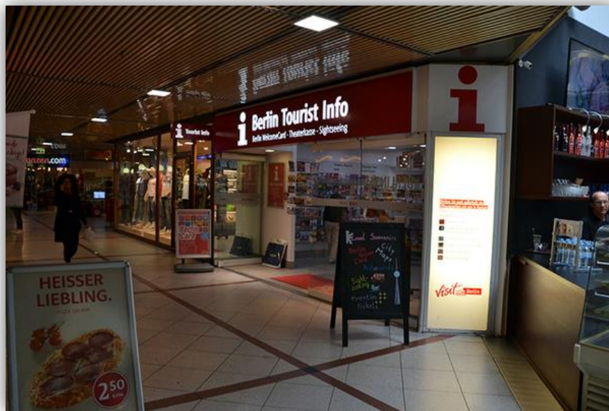
Berlin Tourist Info im Europa-Center