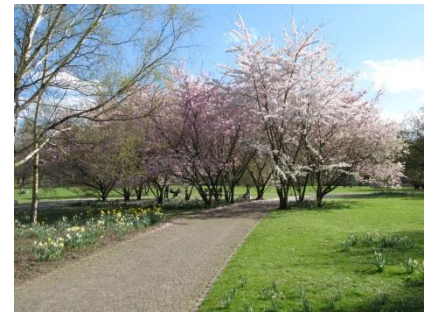
Abb. 7: Wegesystem; Typ 2