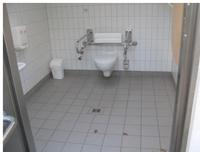
Abb. 11: WC „aux fleurs“