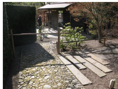
Abb. 25: Japanischer Garten