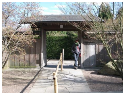
Abb.12: Japanischer Garten