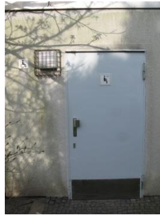
Abb.9: WC Chinesischer Garten