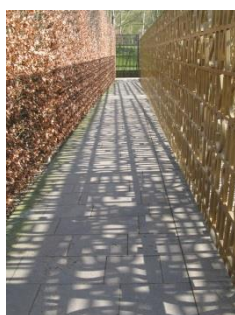
Abb. 14: Christlicher Garten