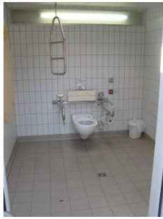
Abb. 8: WC „Café aux Jardins“