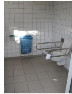
Abb. 10: WC Chinesischer Garten