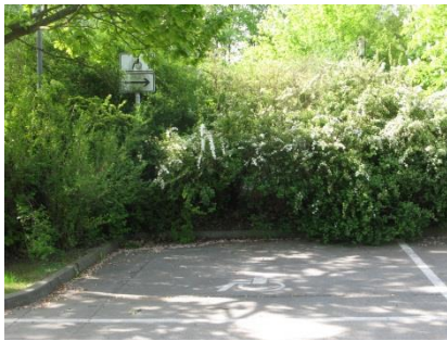
Abb. 2: Parkplatz