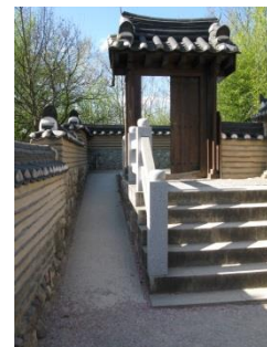
Abb.22: Koreanischer Garten