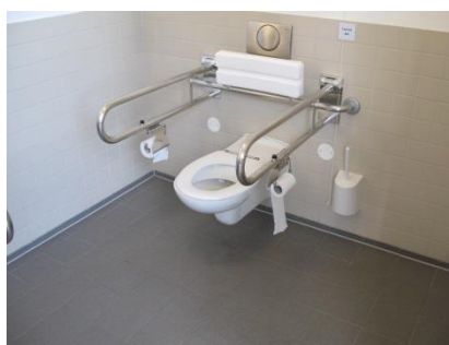
Abb. 6: WC Haupteingang