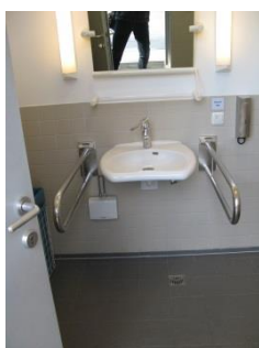
Abb. 11: WC Haupteingang