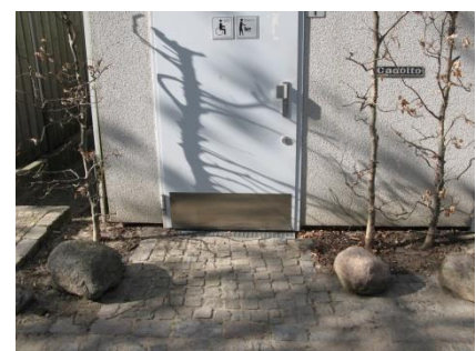
Abb. 7: WC „Café aux Jardins“