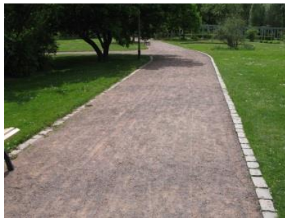
Abb. 9: Wegesystem; Typ 3