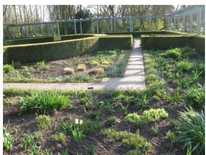
Abb. 32: Staudengarten