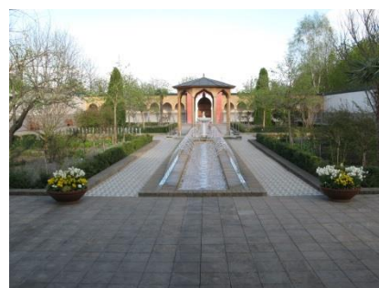
Abb. 28: Orientalischer Garten