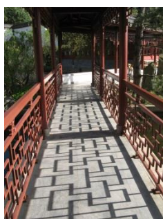
Abb. 26: Chinesischer Garten