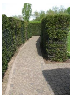
Abb. 333: Irrgarten