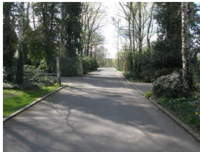
Abb. 6: Wegesystem; Typ 1