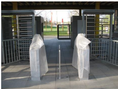
Abb. 5: Haupteingang