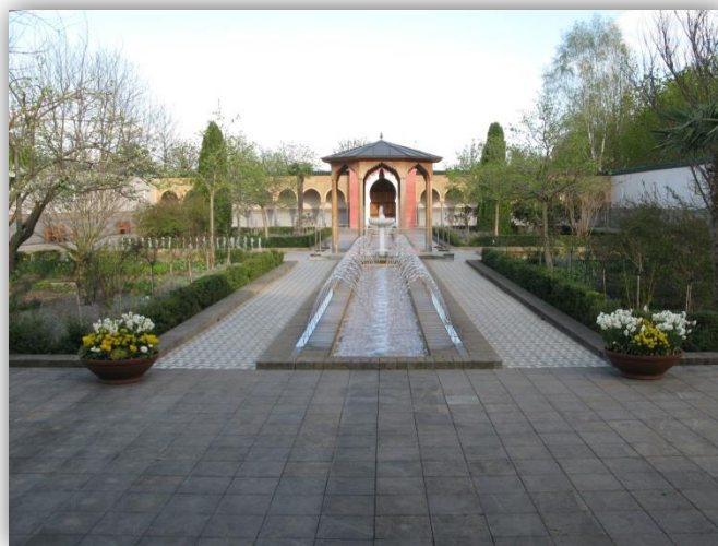
Abbildung 1: Gärten der Welt, Orientalischer Garten