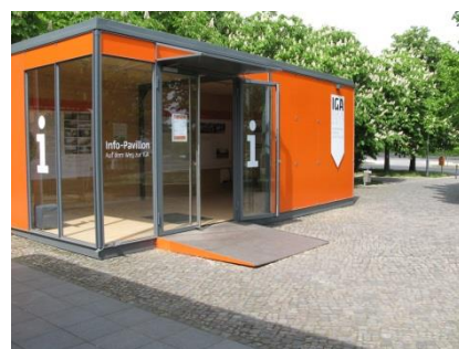
Abb. 34: IGA-Info-Cointainer