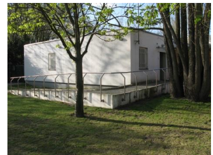
Abb. 19: WC „Orientalischer Garten“