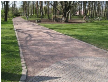
Abb. 8 Wegesystem; Typ 3