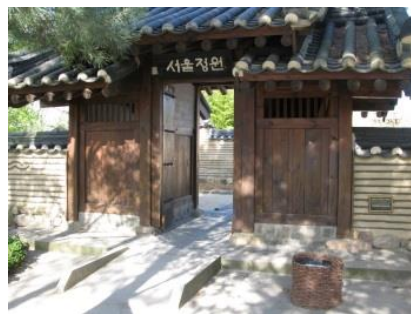
Abb. 21: Koreanischer Garten (Eingang)