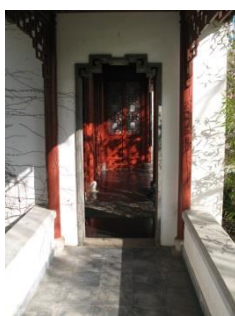
Abb. 27: Chinesischer Garten