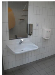
Abb. 18: WC „aux fleurs“