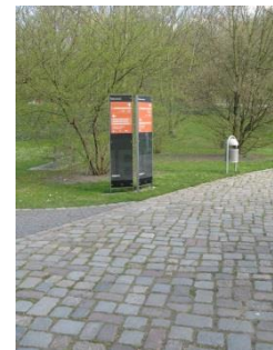
Abb.10: Wegesystem; Typ 4