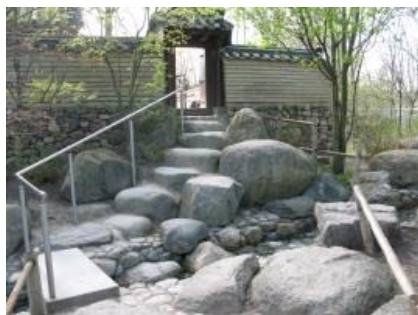
Abb. 23: Koreanischer Garten