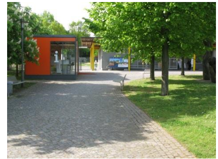
Abb. 4: Weg zum Haupteingang