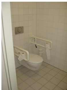
Abb. 20: WC „Orientalischer Garten“